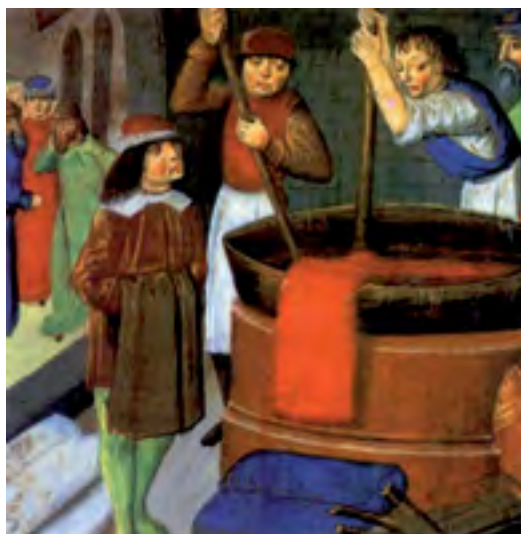
Illustrazione antica d'arte tintoria.

L e tematiche eco/salutistiche conquistano la sensibilità di un pubblico sempre più vasto, attento anche alle questioni legate al tessile e all'abbigliamento. La tintoria Ferrini, impresa specializzata in finissaggio e tintoria di filati e capi di maglieria, ha maturato nel tempo un livello di assoluta eccellenza in tutte le tecnologie tintoriali con particolare attenzione alle fibre di elevata qualità, come i filati in matasse extrafine e pregiati, il fiocco di cashmere, la maglieria in cashmere e cashmere/seta. Forte della propria esperienza e di un Laboratorio di Ricerca, Sviluppo e Controllo che punta ad un'innovazione continua, l'azienda, oltre ad impegnarsi costantemente nel rispetto delle normative vigenti in ambito internazionale sull'utilizzo tintoriale di prodotti e coloranti, affronta oggi un nuovo studio per approfondire le sue conoscenze dei tinteggi naturali. Il progetto si basa su una collaborazione tra Ferrini e alcuni agronomi esperti di piante tintorie che lavorando in sinergia hanno ricavato dalla tradizione artigianale e da antichi testi specifici le indicazioni